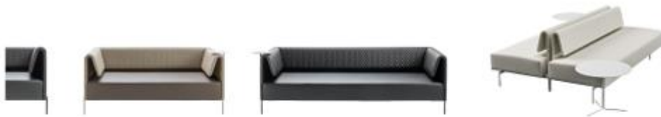
SCHENALE TRAPUNTATO/QUILTED BACK

Sistema di sedute con schienale liscio o trapuntato, formato da moduli fissi ben definiti o componibili tra loro con soluzioni lineari o angolari. Utilizzabile in grandi spazi attesa e d'incontro, o in ambiente domestico.