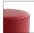
Monocolore One colour